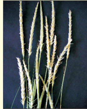
चित्र 22. सेवण के पुष्पक्रम (बालें)