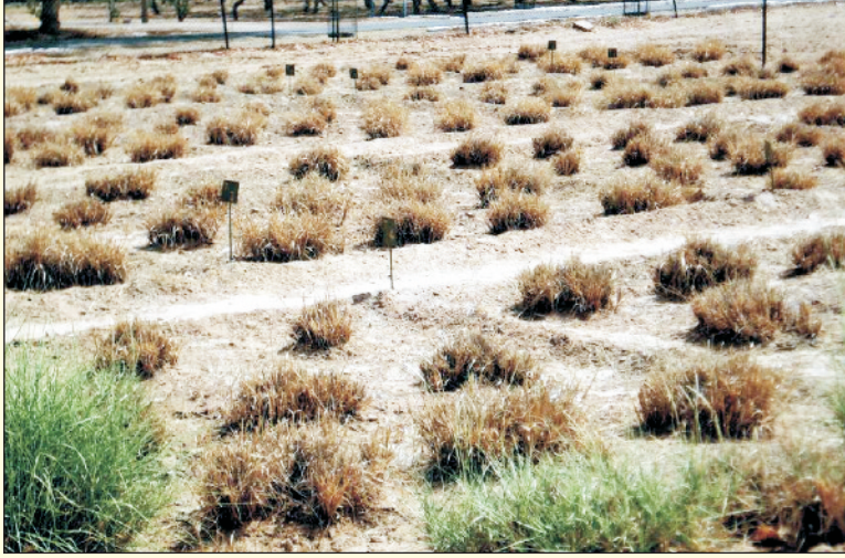
चित्र 15. सुषुप्तावस्था के समय सेवण के बूजे

हालाँकि उस समय वानस्पतिक वृद्धि कम होती है व पुष्पन ज्यादा होता है (चित्र 14)। भूमि में नमी कम होने पर राइजोम्स सुषुप्तावस्था में चले जाते हैं (चित्र 15)। उचित कटाई से सेवण का चरागाह दशकों तक आर्थिक पैदावार देता है।