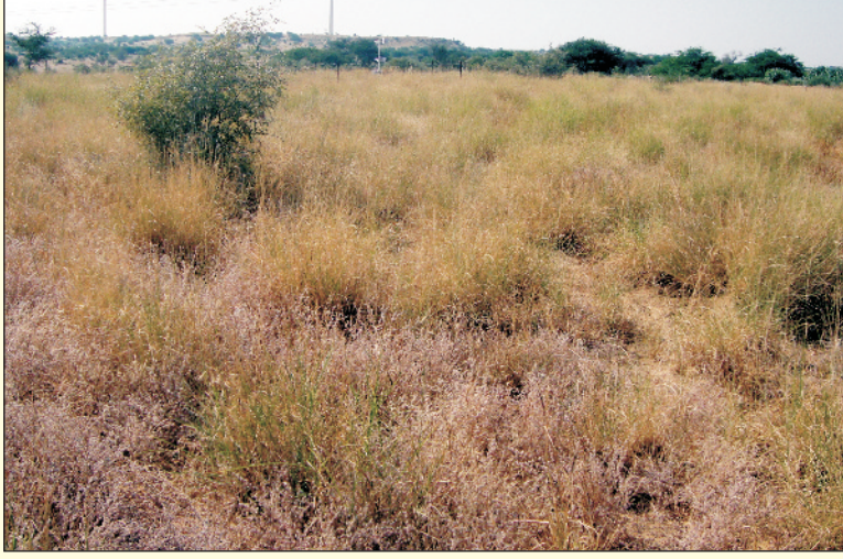
चित्र 5. सेवण घास का प्राकृतिक चरागाह