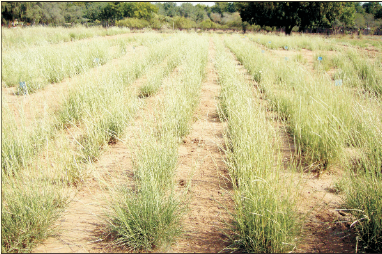
चित्र 1 4. स्थापना वर्ष में मार्च में सेवण की बढ़वार

अगर हरे चारे की पैदावार अधिक हो तो इसका कुछ हिस्सा सुखा लेना चाहिए जो चारे की कमी के समय में पशुओं को खिलाना चाहिए। सेवण को जब भी भूमि में उचित नमी मिलती है फूटान शुरू हो जाती है, क्योंकि यह एक प्रकाश से अप्रभावित घास है। शीत ऋतु व ग्रीष्म ऋतु में वर्षा होने पर भी इसकी बढ़वार होती है।