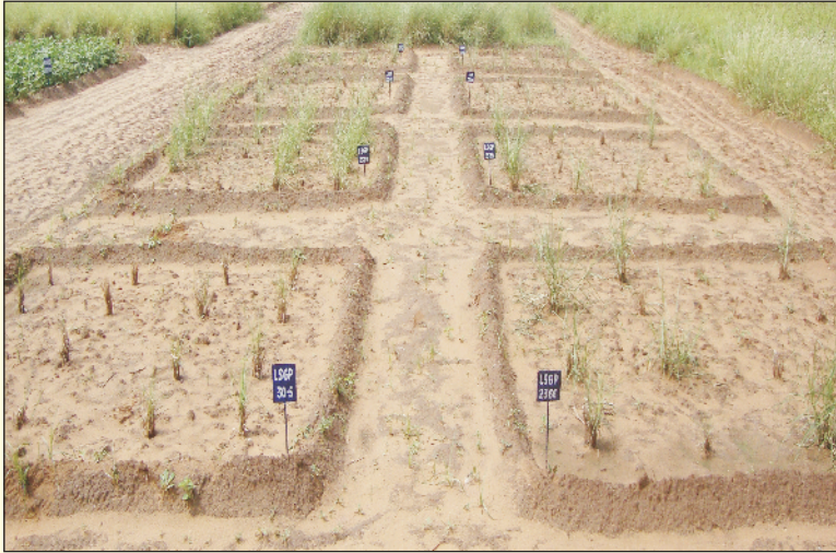
चित्र 1 2. जड़ों द्वारा बुवाई की विधि