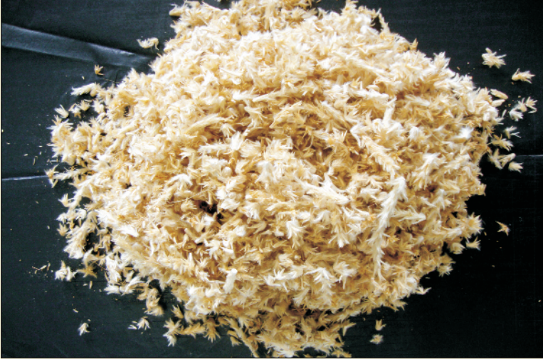
चित्र 25. सेवण के शुद्ध बीज

पकने के अनुसार बालों से बीजों को इकट्ठा करने पर श्रम ज्यादा लगता है व बीजों के गिरने की संभावना हमेशा बनी रहती है। बीज पकने के बाद जल्दी ही जमीन पर गिर जाते हैं। कुछ लोग जमीन पर गिरे हुए बीजों को भी इकट्ठा करते हैं। इस तरह से इकट्ठा किये हुए बीजों में यह जरूरी नहीं कि उनमें दाने हों। जमीन पर गिरे हुए बीजों के दाने चींटियों व पक्षियों द्वारा खाये हो सकते हैं। इस तरह से इकट्ठे किये हुए बीज की भौतिक शुद्धता बनाए रखना असंभव है। अच्छे गुणवत्तायुक्त बीजों की शुद्धता 80 प्रतिशत से कम नहीं होनी चाहिए (चित्र 25)। इसलिए गुणवत्तायुक्त बीजों का उत्पादन एवं इकट्ठे करने के लिए कुछ नई तकनीकों का विकास किया गया है। बीजों को, पकने के अनुसार बालों से इकट्ठा करने के लिये (अ) बालों को निकलने के 20 दिन बाद काटा जाता है तथा (ब) रुपान्तरित विधि से बीजों को इकट्ठा करते हैं।