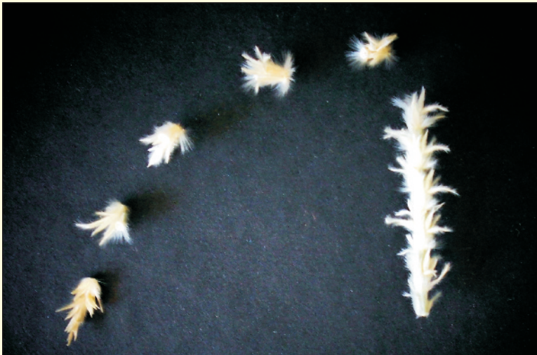
चित्र 24. सेवण के बालों में बीजों के पकने के बाद गिरना

इससे सभी बीजों को इकट्ठा करना मुश्किल होता है व बीज उत्पादन कम होता है। यद्यपि इस विधि से इकट्ठे किए गए बीजों का अंकुरण अन्य विधियों की तुलना में अधिक होता है। अतः केन्द्रीय शुष्क क्षेत्र अनुसंधान संस्थान, जोधपुर में बीज इकट्ठा करने की नई विधियाँ विकसित की गई हैं।