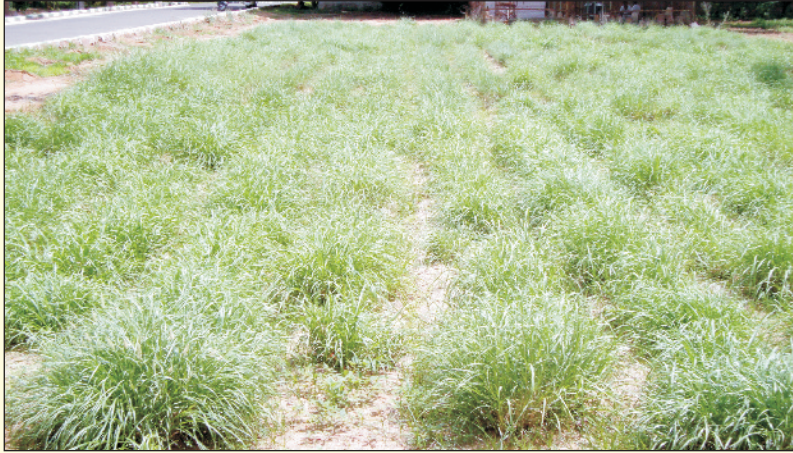
चित्र 16. पहले से स्थापित सेवण में प्रभावी वर्षा के दसवें दिन की बढ़वार