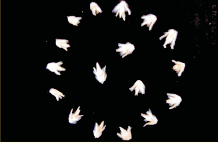
चित्र 9. सेवण के बीज

सेवण के बीज का पर्याय है कि उसमें, दो प्रजनन योग्य (बिना डंठल वाली) स्पाइकलेट्स, एक प्रजनन अयोग्य (डंठल वाली) स्पाइकलेट तथा डंठल (pedicel) सहित अक्ष (rachis) का भाग हो। यह एक प्रकीर्णन इकाई है, जो बीज की वानस्पतिक परिभाषा से भिन्न है (चित्र 9)।