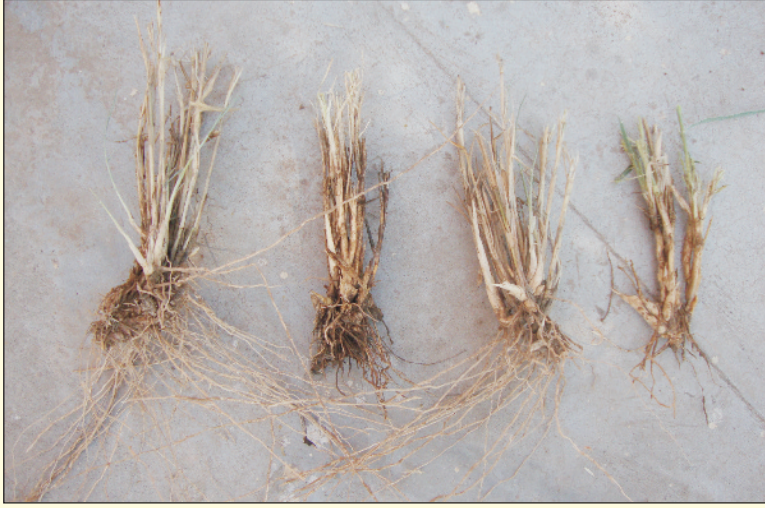
चित्र 1 1. सेवण की जड़ें व राइजोम्स