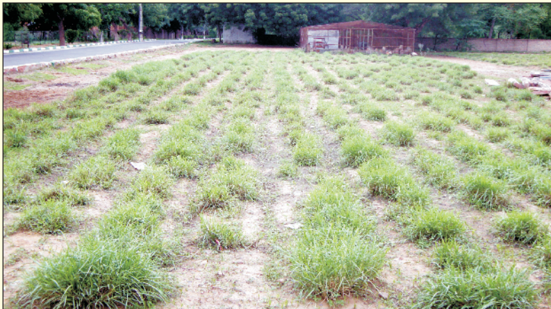
चित्र 18. भेड़-बकरियों द्वारा चराई के बाद सेवण घास