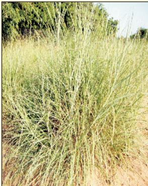
चित्र 3. सेवण घास का पौधा

घासों बहुमूल्य वानस्पतिक क्षेत्र बनाती हैं, जानवरों के लिए चारा प्रदान करती हैं, भूमि के क्षरण को रोकती हैं व भूमि का उपजाऊपन बढ़ाती हैं। सेवण घास जिसका वानस्पतिक नाम लेज्युरस सिडिकस है, पोएसी परिवार का बहुवर्षीय पौधा है (चित्र 3)। यह अच्छे विकसित जड़-राइजोमस तंत्र के कारण सुखा सहन कर सकती है (चित्र 4), जिससे यह रेतीली भूमि के उन क्षेत्रों में जहाँ वार्षिक वर्षा 100–300 मिमी होती है, आसानी से उगती है (चित्र 5 व 6)। इसलिए सेवण को शुष्क क्षेत्र के “घासों का राजा” भी कहा जाता है।