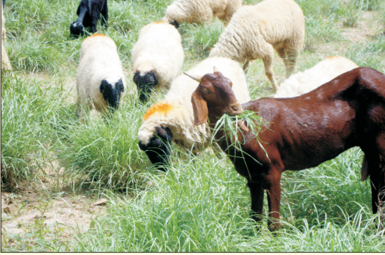
चित्र 8. सेवण घास को चाव से खाती हुई भेड़-बकरियाँ

सेवण में तने जमीन से निकलते हैं तथा पौधे की आकृति लगभग झाड़ीनुमा बनती है व पौधा 100–125 सेमी तक ऊँचा बढ़ता है। प्ररोहों की संख्या बहुत ज्यादा होती है (चित्र 3)। यह जानवरों के लिए पाचक व पोषक घास है। बढ़वार की प्रारम्भिक अवस्था में भेड़ व बकरियाँ इसको बड़े चाव से खाती हैं (चित्र 8)। गायों के लिए भी यह एक उत्तम घास है। ताजा पत्तियों में अपरिष्कृत प्रोटीन की मात्रा 7 से 14 प्रतिशत तक होती है। पकने के समय भी अपरिष्कृत प्रोटीन की मात्रा 4–6 प्रतिशत तक पाई जाती है। पोषण में बाधक तत्व नहीं के बराबर होते हैं, जिससे इस घास को बढ़वार की प्रारम्भिक अवस्था में पशुओं को बेझिझक खिलाया जा सकता है।