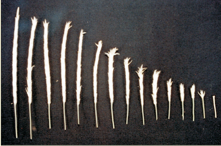
चित्र 23. सेवण घास के बीजों का पकना

उष्ण क्षेत्र की अन्य घासों की तरह सेवण की बीज उत्पादकता कम होती है। सेवण के बीज, पुष्पक्रम (बाल) में ऊपरी दिशा से पकना शुरू होते हैं व पकने के उपरान्त जल्दी ही जमीन पर गिर जाते हैं (चित्र 21 से 24)। अतः पकने के क्रम से बीजों को इकट्ठा करना बहुत ही श्रम वाला कार्य है व बीज इकट्ठा करने की लागत ज्यादा रहती है।