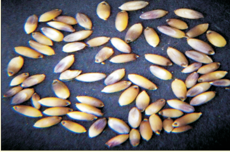
चित्र 10. सेवण के दाने

बीज, श्रम व बुआई के काम आने वाले अन्य संसाधनों की उपलब्धता के अनुसार बुआई विधि का चुनाव निम्नलिखित विधियों में से कर सकते हैं।