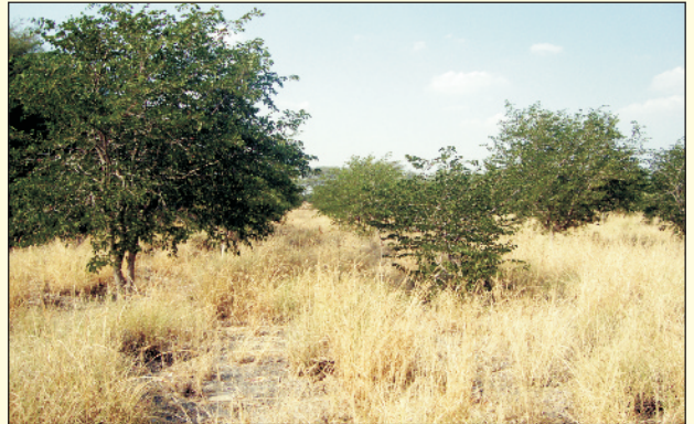
चित्र 13. सेवण घास का वनचरागाह