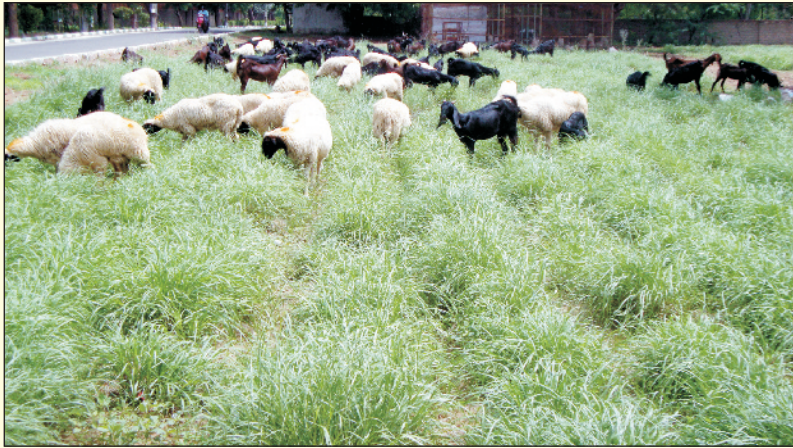
चित्र 17. स्थापित सेवण में प्रभावी वर्षा के ग्यारहवें दिन भेड़-बकरियों द्वारा चराई