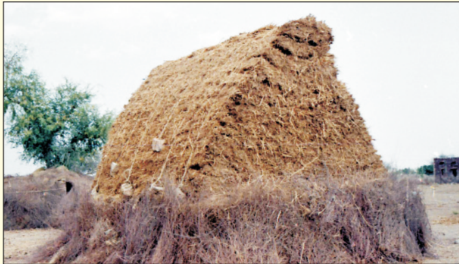
चित्र 19. चारा भण्डारण की प्रचलित विधि

‘हे’ बनाने के लिए घास को दिन के समय काटना चाहिए, जब ओस पूरी तरह से सूख जाए। कटाई के समय जमीन गीली नहीं होनी चाहिए अन्यथा घास समान रूप से नहीं सूखेगी। ‘हे’ बनाने के लिए घास की कटाई लगभग 50 प्रतिशत कल्लों में बालें निकलते समय करें। कटाई के बाद घास को ज्यादा समय धूप में नहीं रखना चाहिए। सुखाते समय ध्यान रहे कि पत्तियाँ अलग न हों। पत्तियों व केरोटिन के बचाव हेतु सुखाने का कार्य सुबह के समय ही करना उचित रहता है। जब वर्षा होने वाली हो तो चारे को त्रिपद आधार या कम ऊँचाई की बाड़ पर भी सुखाया जा सकता है। त्रिपद आधार 5 सेमी मोटे, 2–3 मीटर लम्बे मजबूत लकड़ी के डंडों या धातु की छड़ से बनाए जाते हैं। एक त्रिपद पर 250–300 किलोग्राम ताजा चारा आ जाता है। जल्दी सूखने के लिए चारे को जल्दी ही जमीन से उठा लेना चाहिए। ‘हे’ के संग्रहण के लिए किसी खास संरचना के संग्रहक की आवश्यकता नहीं होती। ‘हे’ को छायादार जगह पर ढेर बनाकर रखा जा सकता है, जहाँ जमीन से नमी का ‘हे’ से सम्पर्क न हो। इस प्रकार से संग्रहित ‘हे’ को आवश्यकतानुसार जानवरों के खिलाने के लिये प्रयोग में लाया जा सकता है।