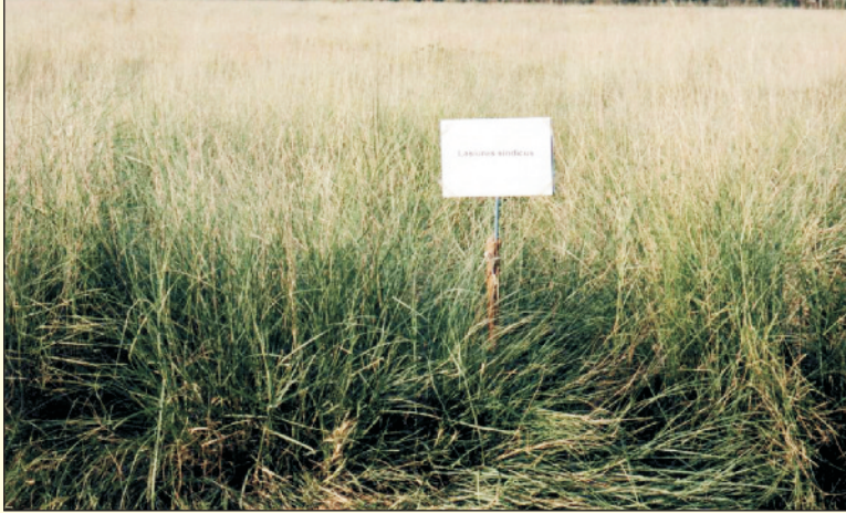
चित्र 20. सेवण का बीज उत्पादन

अधिक पशु घनत्व व जलवायु की विषमता के कारण थार मरुस्थल में प्राकृतिक चराई भूमि की दशा अच्छी नहीं है। पशु व भूमि विकास से जुड़े लोगों एवं संस्थाओं द्वारा इस क्षेत्र की चराई भूमि के विकास की आवश्यकता महसूस की जाती रही है। इस कार्य के लिए उच्च गुणवत्ता के बीजों की आवश्यकता पड़ती है जो पर्याप्त मात्रा में उपलब्ध नहीं हो पाते। यद्यपि सेवण को वानस्पतिक प्रजनन (rooted slips) द्वारा भी लगाया जा सकता है, लेकिन वे भी चरागाह लगाने के स्थान पर पर्याप्त मात्रा में उपलब्ध नहीं हो पाती। बड़े क्षेत्र में वानस्पतिक प्रजनन द्वारा चरागाह लगाना मंहगा पड़ता है व कठिन होता है। इस विधि से चरागाह लगाने हेतु पानी की सुनिश्चितता भी आवश्यक है। अतः बड़े क्षेत्र में चरागाह लगाने के लिए सीधे बीज द्वारा चरागाह लगाना ही एक उचित समाधान है। सेवण घास के बीज की माँग की तुलना में उपलब्धता बहुत कम है। एक अनुमान के अनुसार सेवण के बीज की वर्तमान आवश्यकता लगभग 600 मैट्रिक टन है जो वर्ष 2015 तक 622 मैट्रिक टन हो जाएगी। केन्द्रीय शुष्क क्षेत्र अनुसंधान संस्थान, जोधपुर में सेवण घास के बीजों का उत्पादन किया जाता है (चित्र 20) जिनकी माँग लगातार बढ़ रही है।