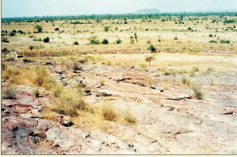
चित्र 2. शुष्क क्षेत्र की कम उपजाऊ बंजर भूमि

राजस्थान में हरे व सूखे चारे की अनुमानित माँग, क्रमशः 549 व 539 लाख टन है जबकि उपलब्धता केवल 350 व 264 लाख टन ही है। शुष्क क्षेत्र में अकाल के समय चारे की माँग और आपूर्ति में अन्तर बढ़ जाता है। इस क्षेत्र में सामान्य वर्षा की स्थिति में चारे के विभिन्न स्रोतों जैसे खेती, खेती के अवशिष्ट, परती व चरागाहों से पशुओं के चारे की दो तिहाई माँग की ही पूर्ति हो पाती है। पड़ोसी राज्यों से चारा मंगवाना यहाँ के लिए एक सामान्य प्रक्रिया है। अतः शुष्क क्षेत्र की कम उपजाऊ व बंजर भूमि का चराई हेतु विकास/पुनर्जीवन पशुओं के लिए चारा आपूर्ति में सहायक होगा।