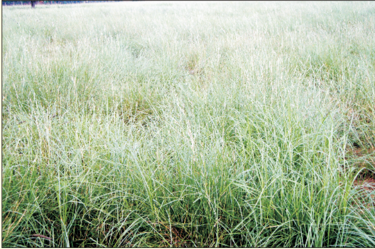
चित्र 6. विकसित की गई सेवण घास

सेवण घास प्रायः हल्की, चूनायुक्त, रेतीली भूमि व रेतीले टिब्बों के लिए उपयुक्त है। दोमट बलुई भूमि में यह घास आसानी से उगती है। यह घास मिश्र, सोमालिया, अरब, एबिसिनिया, पाकिस्तान (सिंध) व भारत में पायी जाती है। भारत में मुख्यतया पश्चिमी राजस्थान (जैसलमेर, बाड़मेर, बीकानेर, जोधपुर, चुरू जिले) में यह अन्य घासों के साथ उगती पाई जाती है (चित्र 7 व सारणी 1)। पिछले दशक तक जैसलमेर जिले का 80 प्रतिशत भू-भाग जिसमें नाचना, पश्चिमी पूगल, मोहनगढ़, सुल्ताना और बिंजेवाला जहाँ वार्षिक वर्षा 100–150 मिमी होती है, में सेवण घास उगती थी।