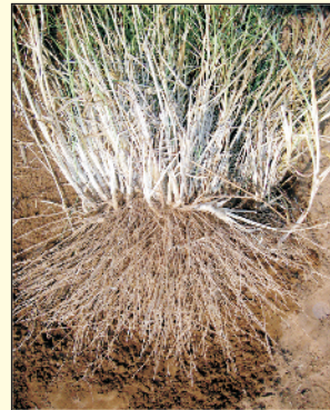
चित्र 4. सेवण घास का जड़-राइजोमस तंत्र