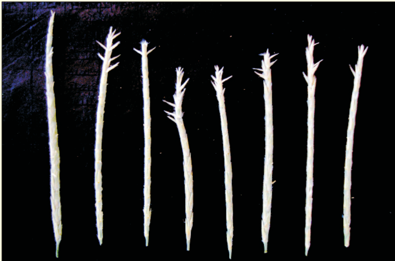
चित्र 26. सेवण के बीजों को इकट्ठा करने की उचित अवस्था