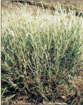
चित्र 21. सेवण में बहुतायत में पुष्पक्रमों (बालों) का बनना